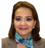
Campa Almaral Carmen Victoria G.P.:NA Entidad: Sinaloa Curul: Circ.:1